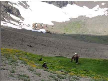
Pié del Cerro Piuquencillo