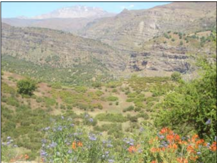
Paisaje vista sur