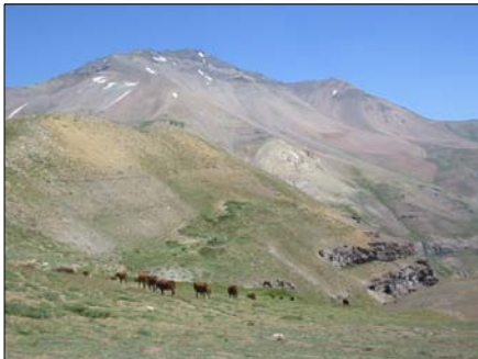
Límite entre predios