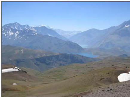
Vista hacia Embalse El Yeso